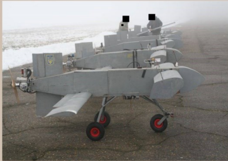
AQ 400 Scythe